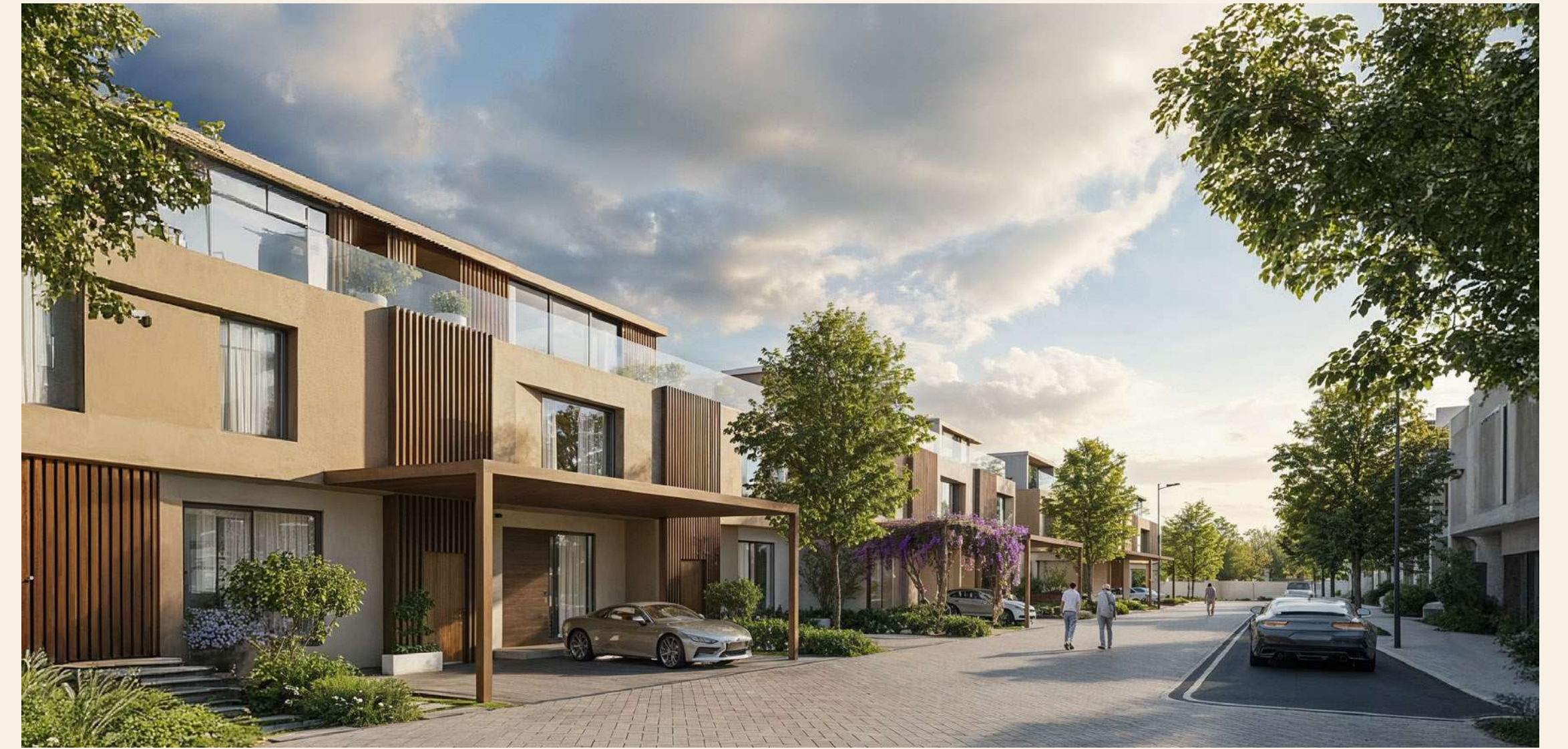
سري - 2025

رؤيتنا المستقبلية نطمح في جريد إلى أن نكون رمزًا رائدًا في بناء مجتمعات متكاملة ومستدامة، حيث يلتقي التصميم المبتكر مع جودة الحياة. نطلق من مواقع مميزة ومشاريع متعددة الاستخدامات لنصنع تجارب عمرانية تلهم الحاضر وتستشرف المستقبل، مستندين إلى رؤية استثمارية واضحة وفهم عميق لتحولات السوق محليًا وعالميًا.