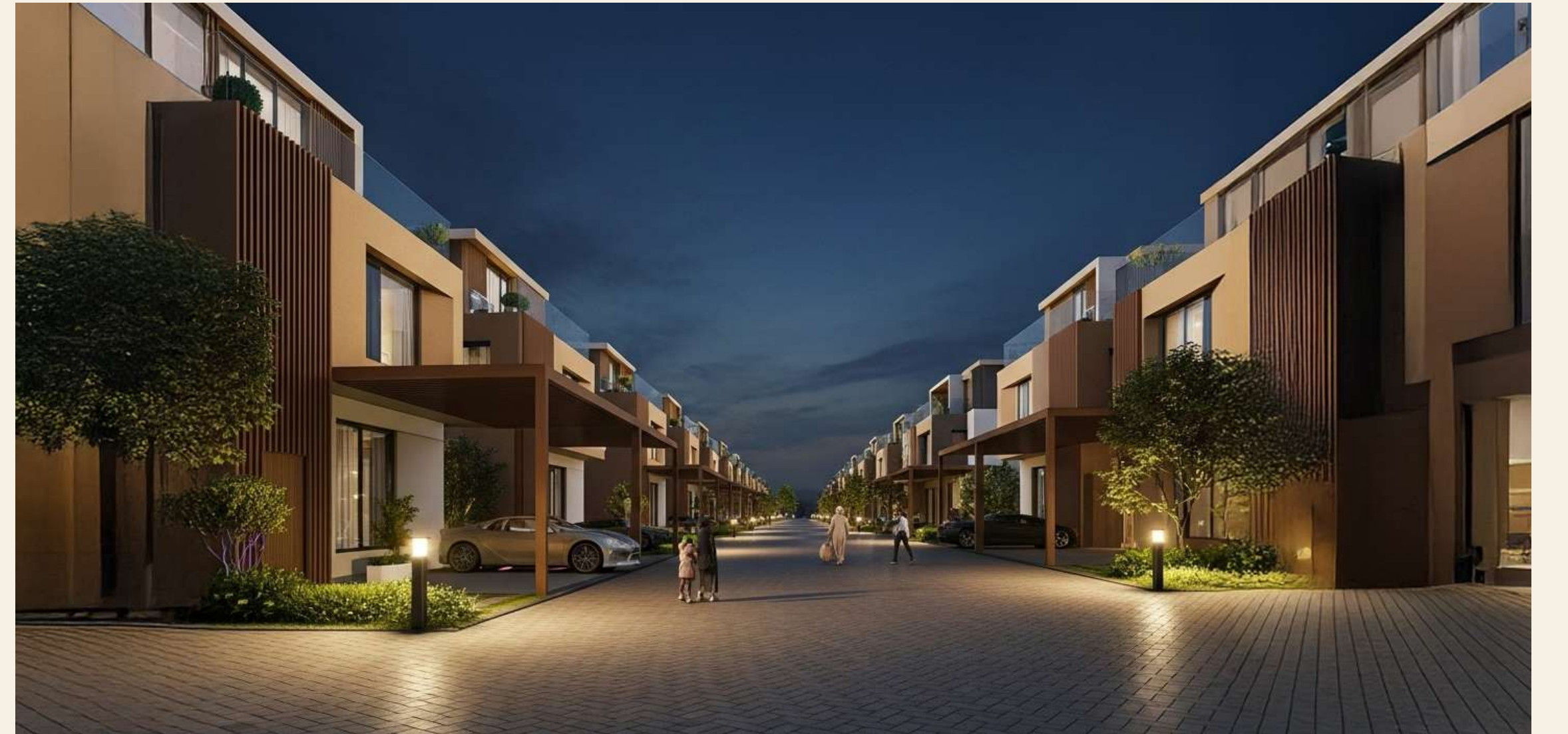
سري - 2025

نؤمن أن التطوير الناجح يبدأ بفهم الناس، واحتياجاتهم، وتطلعاتهم، وأساليب حياتهم، ويرتكز على احترام البيئة والمجتمع.